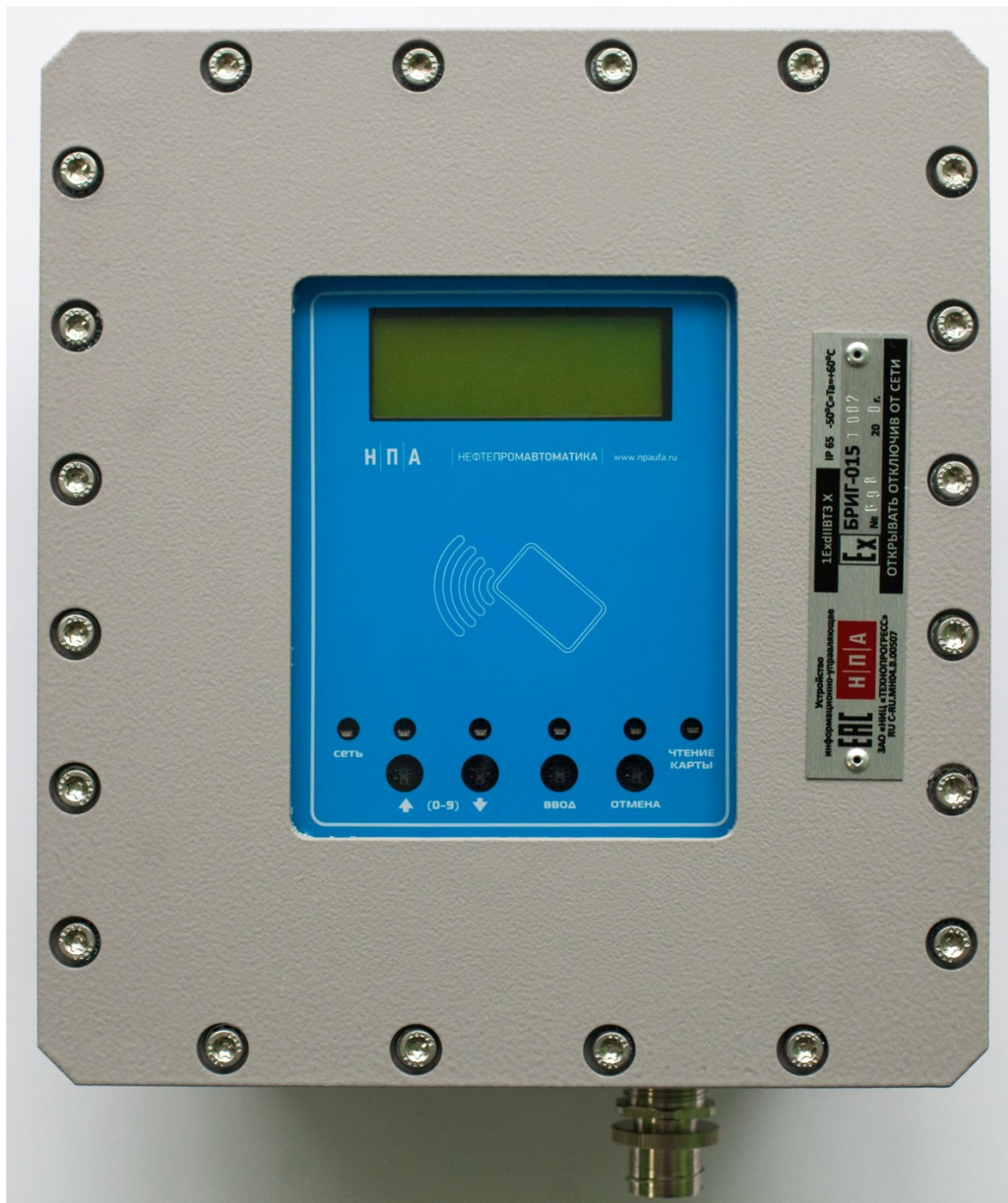
Рис.1. ТЕРМИНАЛ КАРТОЧНЫЙ БРИГ-015-T002.